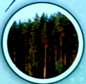
B079 Орман шаруашылығы