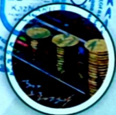
B046 Қаржы, экономика, банк және сақтандыру ісі