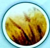
B077 Өсімдік шаруашылығы